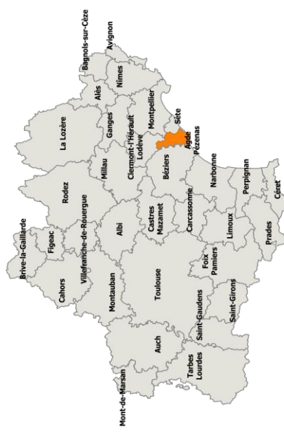
Population légale 2014 (en vigueur le 1er janvier 2017)